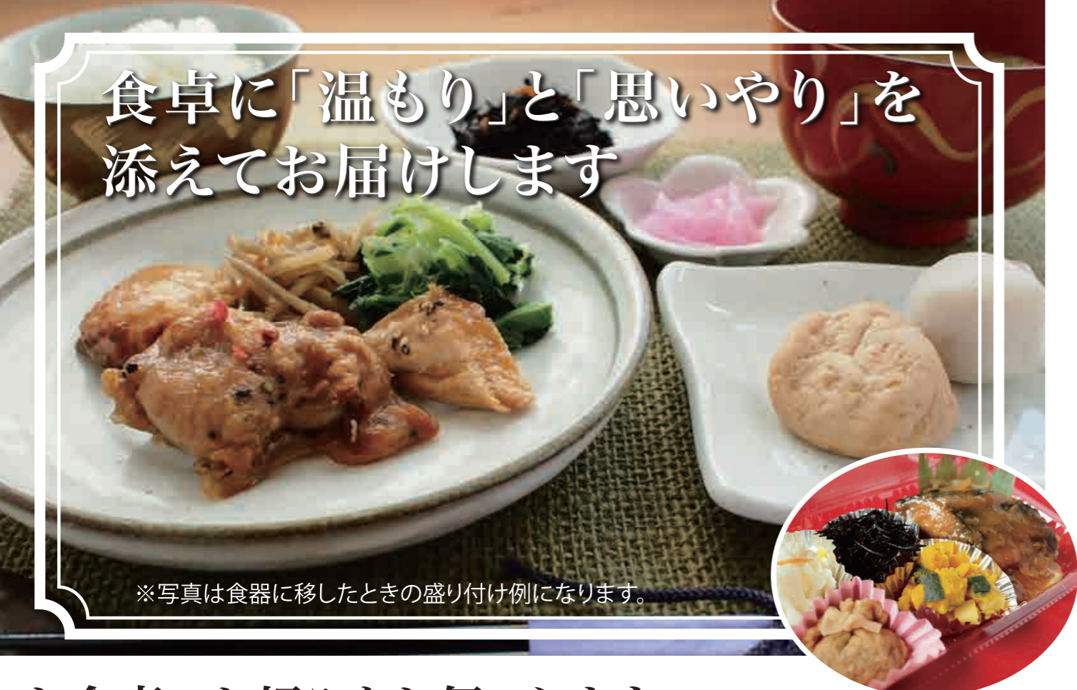
※写真は食器に移したときの盛り付け例になります。