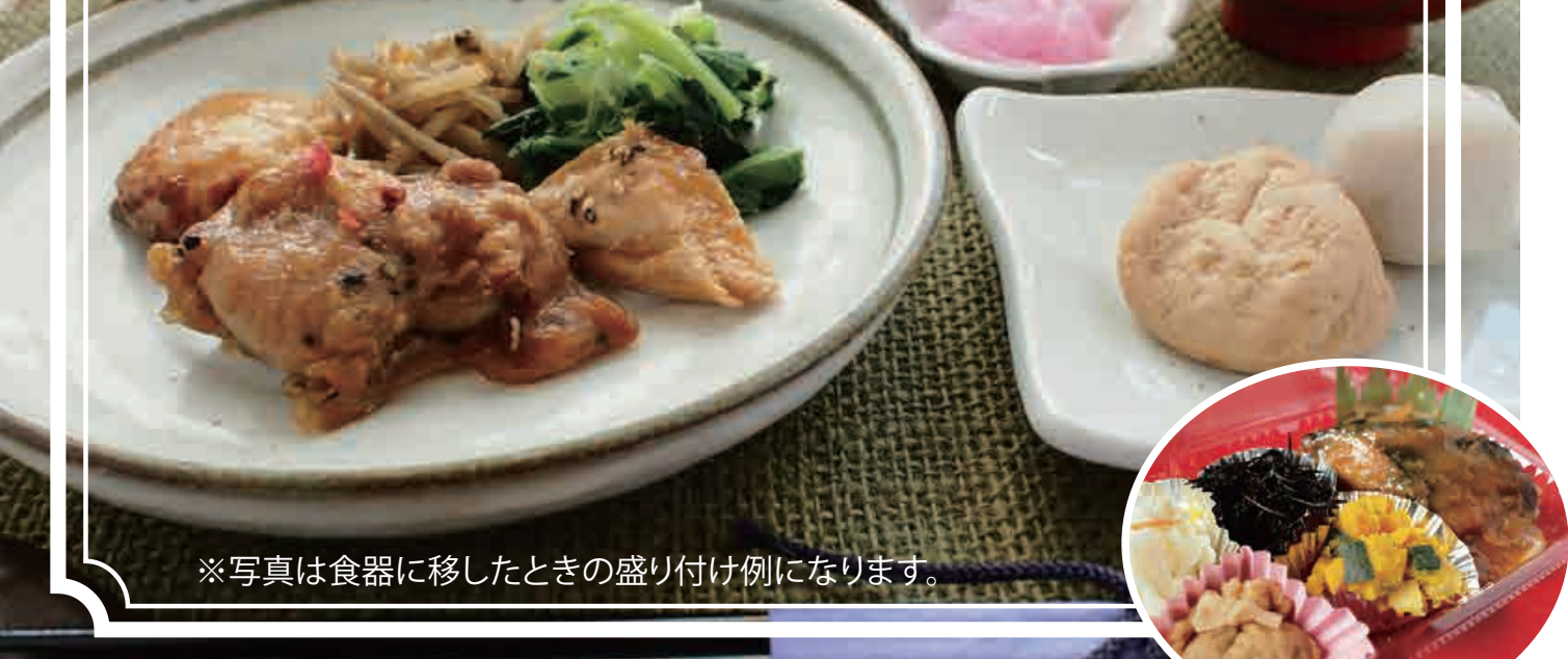
※写真は食器に移したときの盛り付け例になります。